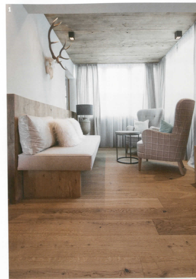
Foto gross+2 Modernes Fischgrät «Longlife-Parkett Residence PS 500», Eiche weiss, gebürstet und naturgeölt. Meisterwerke Schulte GmbH 1 Mit dem einfachen Klick-System ist der neue Boden schnell verlegt. «Eiche Salis Elegance» aus der Serie «Modico», Sabag

Jedes Stück ein Unikat: Wenn Mutter Natur fürs Design zuständig ist, kommt Leben in die Stube. Lebhaftige Maserungen und klassische Formate sind auch und gerade in modernen Häusern sehr gern gesehen. Von Christine Vollmer